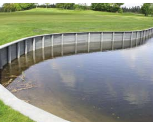
Spunsvæg i recycling plast langs fairway

God økonomi · Slidstærkt · Elegante løsninger · Ingen vedligeholdelse