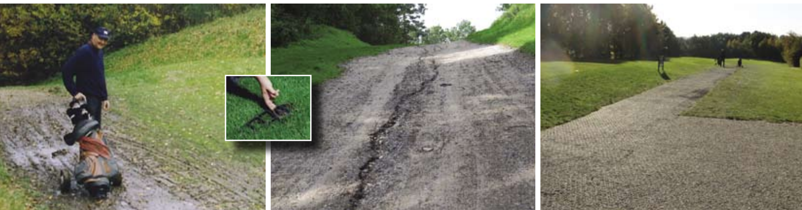
G9 armering løser problemet med smattede områder og eroderede stier

Stabilt og robust · Behageligt at gå på · Skridsikkert · Jævnt underlag