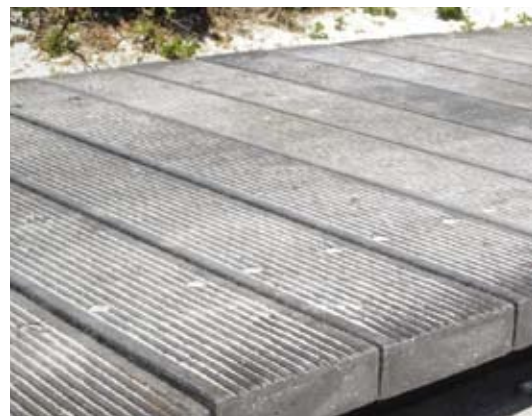
Bro plank til bro/hasardbelægning