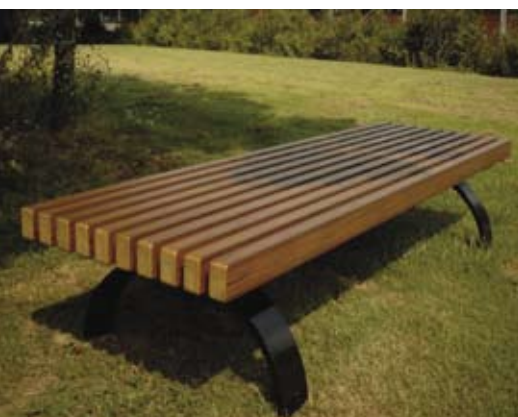
Bænke i certificeret hårdtræ

Økonomisk · Praktisk eller eksklusivt design · Minimal vedligeholdelse