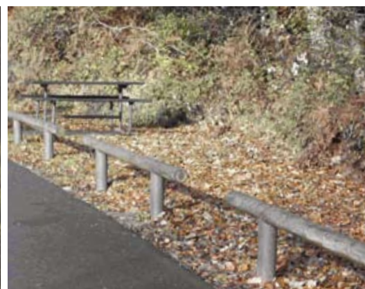
Fodhegn i recycling plast