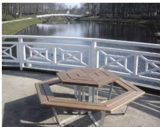
Borde og bænke i vedligeholdelsesfri EverWood