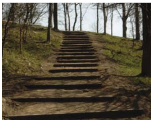
Kantsvle trappe i recycling plast