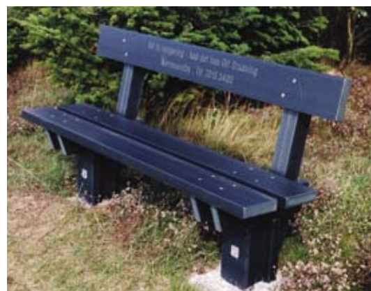
Parkbænk i vedligeholdelsesfri Everwood